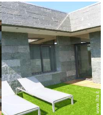
Proprietà di Prestigio