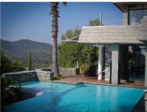
Proprietà di Prestigio