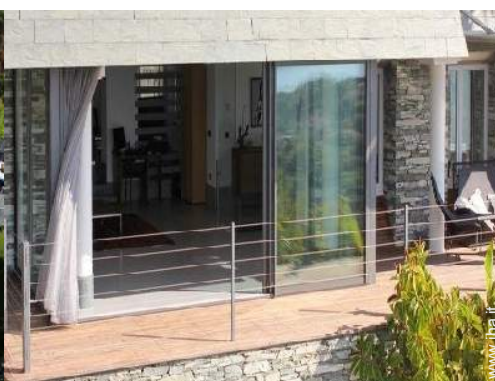
Casa Signorile di Prestigio