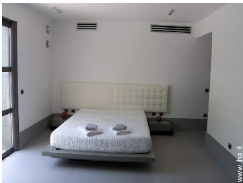
Proprietà di Prestigio