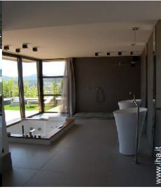
Casa Signorile di Prestigio