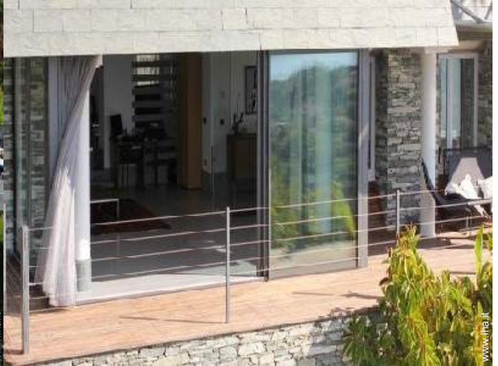
Casa Signorile di Prestigio