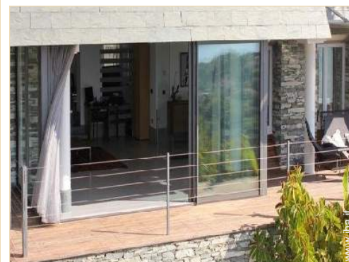
Casa Signorile di Prestigio