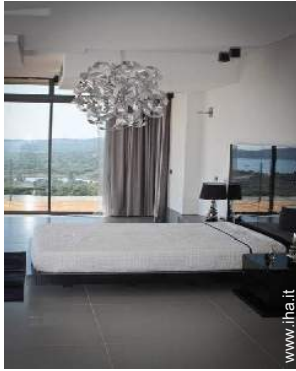
Proprietà di Prestigio