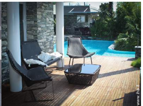
Casa Signorile di Prestigio