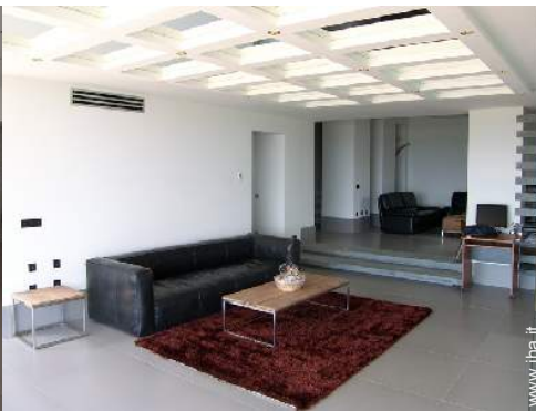
Proprietà di Prestigio