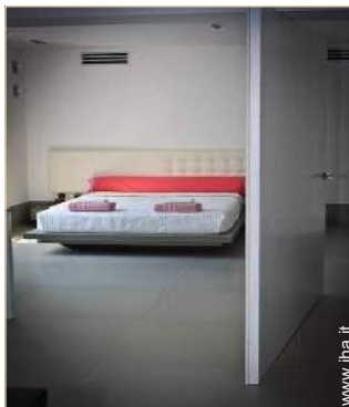
Proprietà di Prestigio