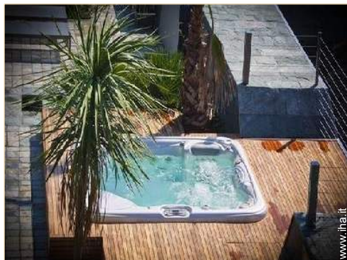
Proprietà di Prestigio

Seggiolone, bagnetto bambino, vasino, box, passeggino