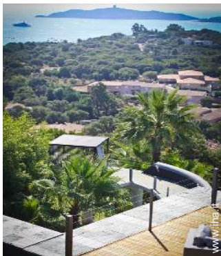
Proprietà di Prestigio