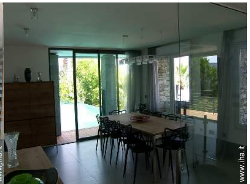
Proprietà di Prestigio