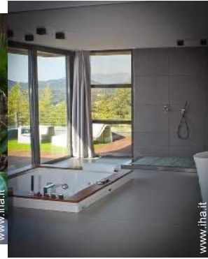
Proprietà di Prestigio