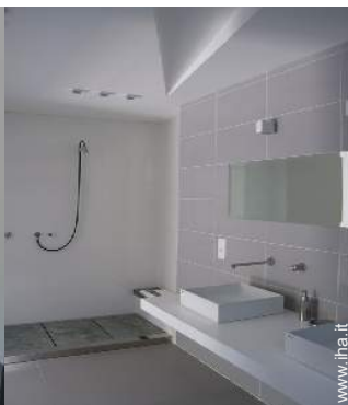
Casa Signorile di Prestigio