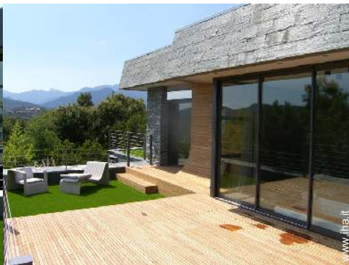
Proprietà di Prestigio