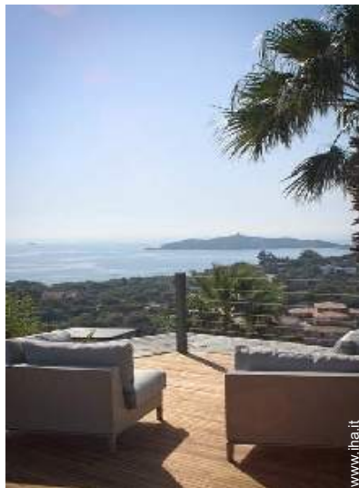
Proprietà di Prestigio