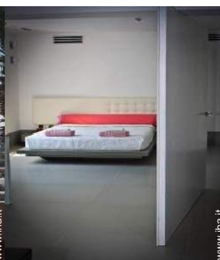
Proprietà di Prestigio