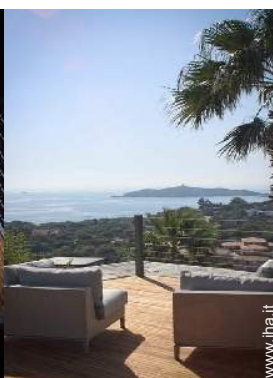
Proprietà di Prestigio