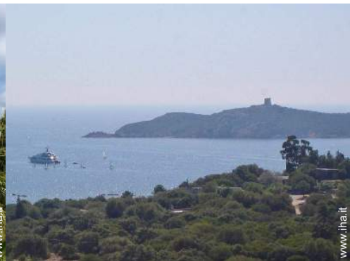
Proprietà di Prestigio