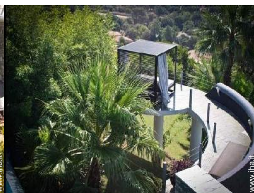
Proprietà di Prestigio