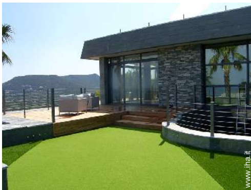
Proprietà di Prestigio