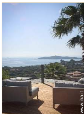
Proprietà di Prestigio