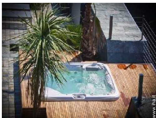
Proprietà di Prestigio