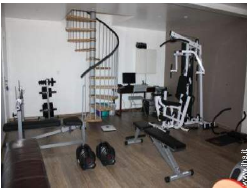
attrezzo(i) per il fitness