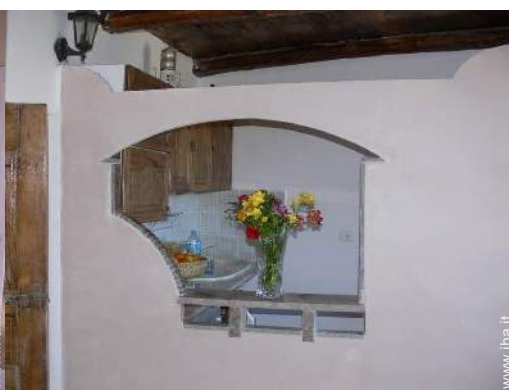
grande cucina in stile americano