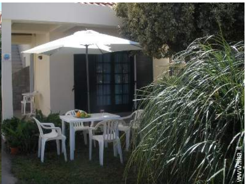
tavolo da giardino