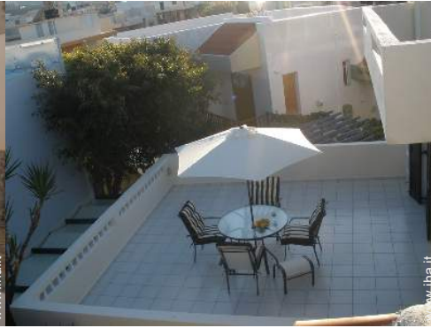
vista dalla terrazza sul tetto