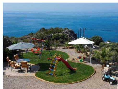
struttura rampicante per bambini