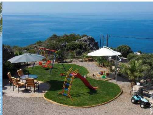
struttura rampicante per bambini