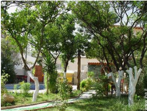
Installazione esterna a disposizione degli ospiti