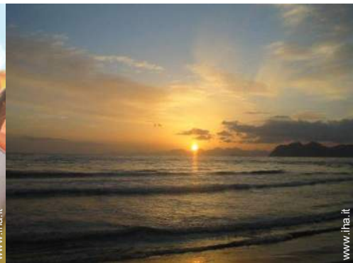
vista sul tramonto