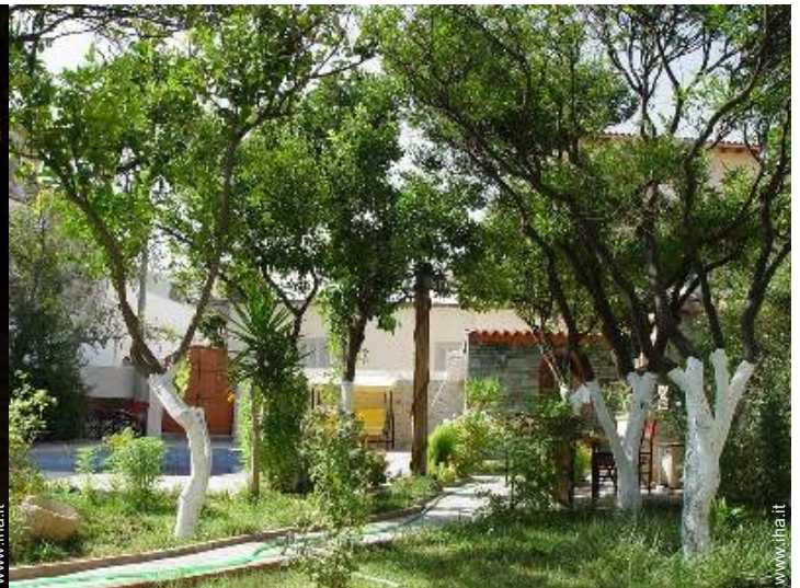
Installazione esterna a disposizione degli ospiti