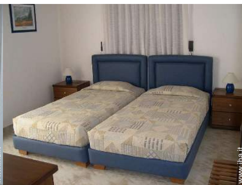
letti gemelli singoli