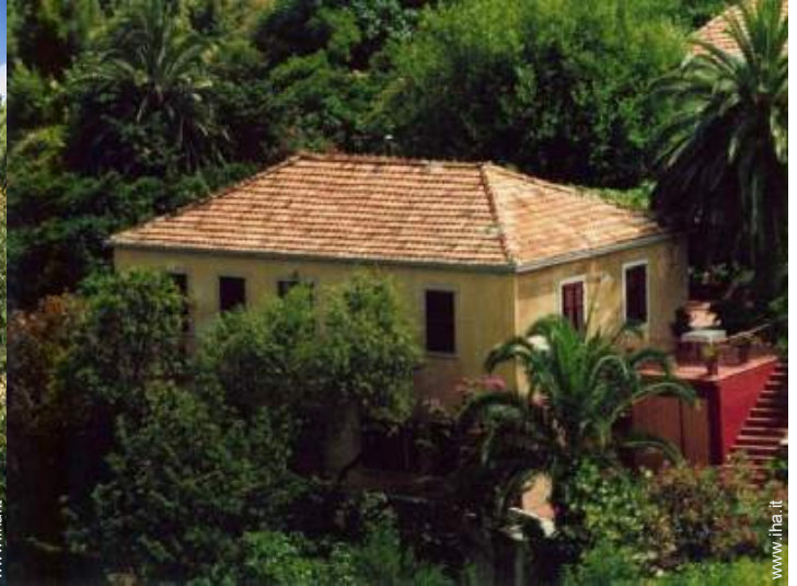
Casa di Villaggio