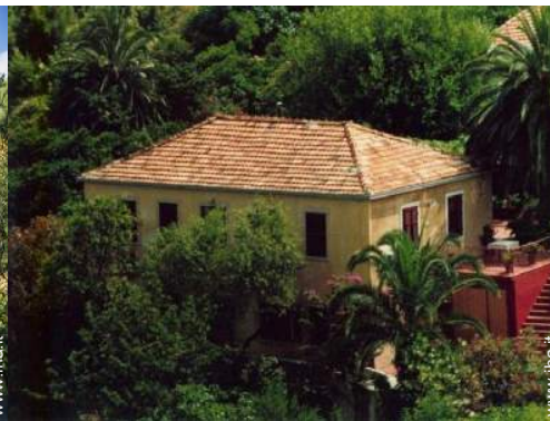
Casa di Villaggio