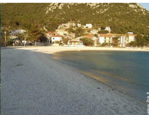
spiaggia con ciotoli