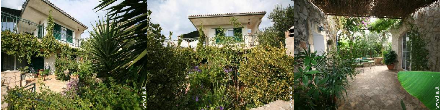
Casa di Charme