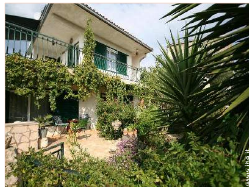
Casa di Charme