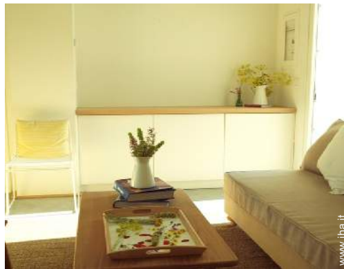
Bungalow di Prestigio