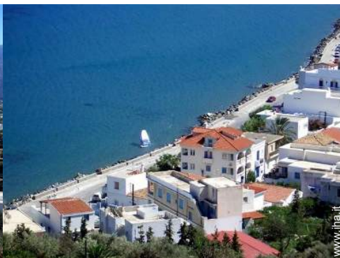
scuola di vela