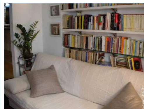
divano(i) letto 1 pers