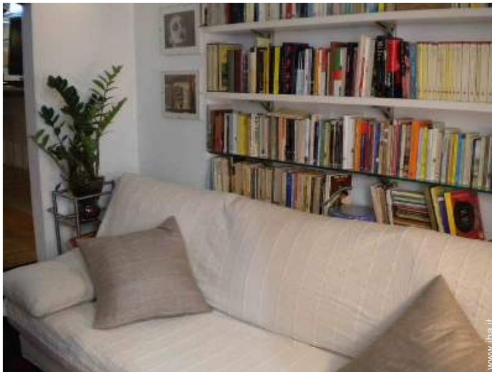
divano(i) letto 1 pers