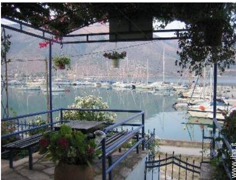
vista sul porto