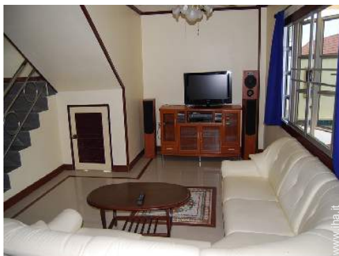
sala di musica