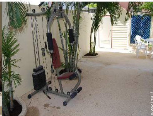
attrezzo(i) per il fitness