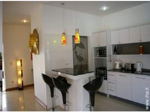
grande cucina in stile americano