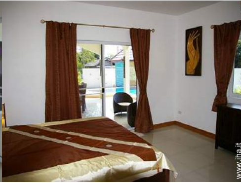
camera del proprietario