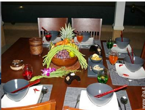
preparazione pasti tipici