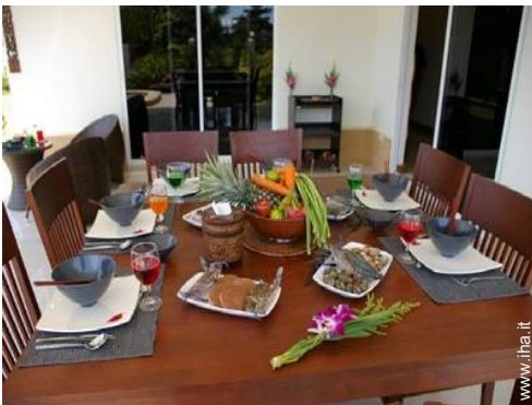
preparazione pasti tipici