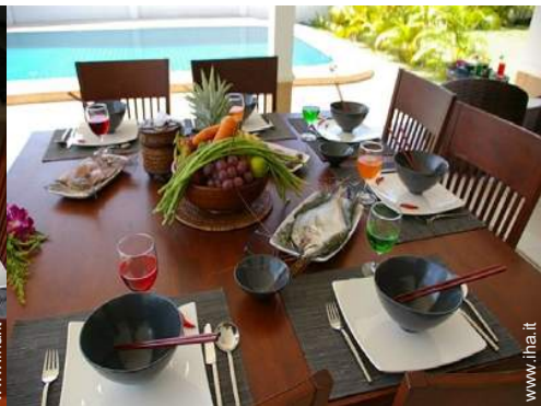
preparazione pasti tipici