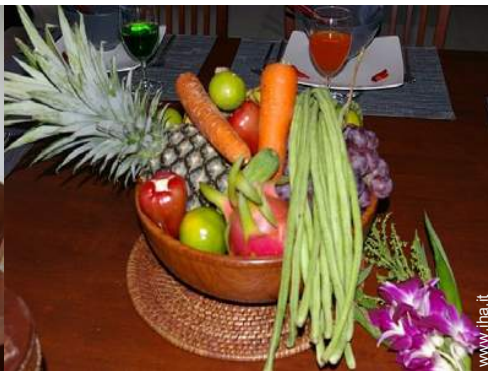
preparazione pasti tipici