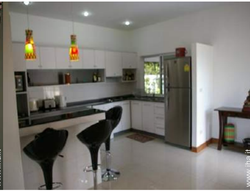
grande cucina in stile americano