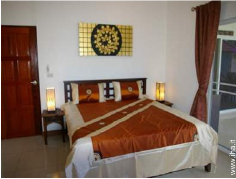
camera del proprietario