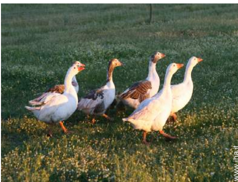
animali da fattoria