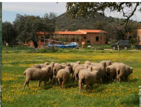
animali da fattoria