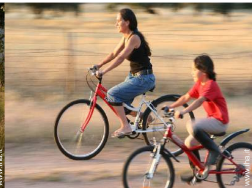
noleggio biciclette/mountain bike