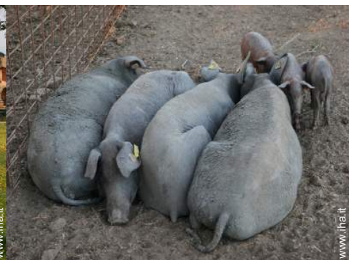
animali da fattoria