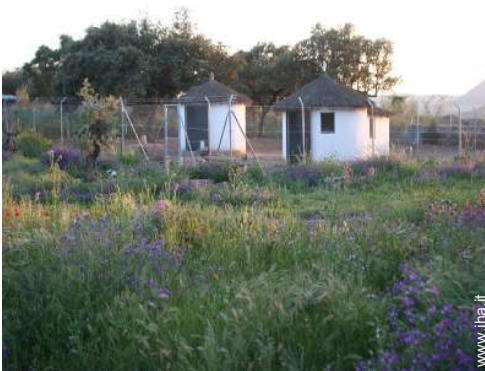
animali da fattoria