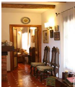
Sistemazione interna a disposizione degli ospiti