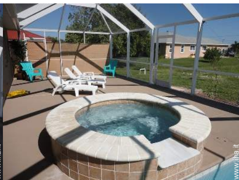
vista dal patio