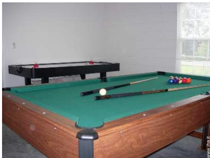
sala dei giochi