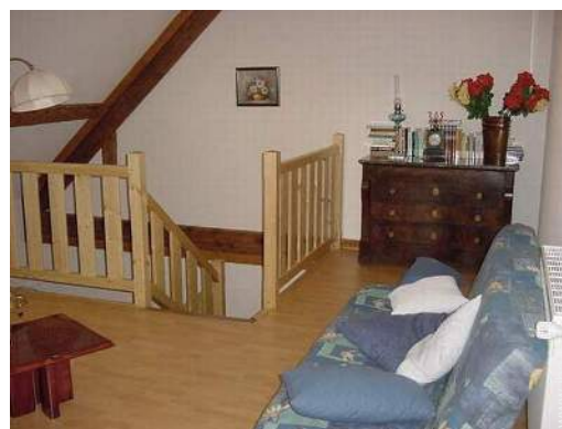
vista dal mezzanino