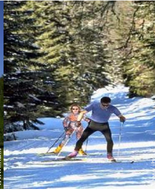
sci di fondo