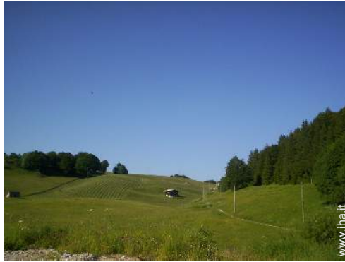
Chalet di Montagna