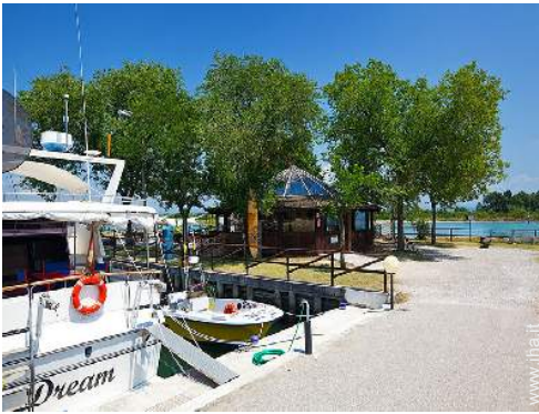
posto barca al porto