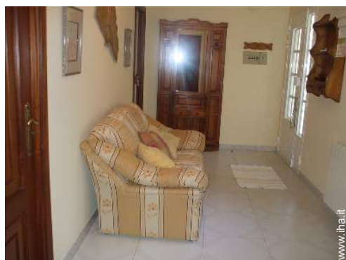
Confort interno ed attrezzature