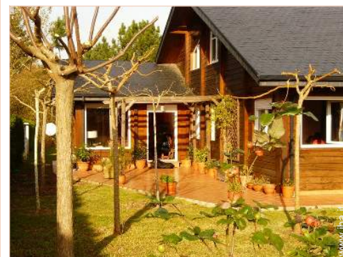
Casa in Legno di Charme