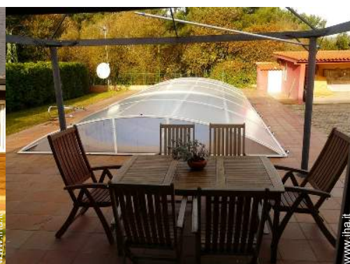
Casa in Legno di Charme