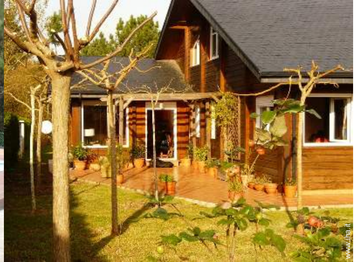
Casa in Legno di Charme