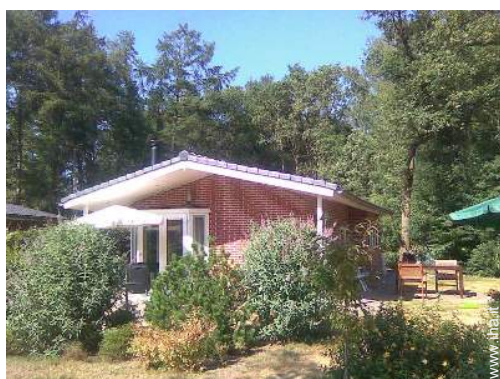
Capannina di Charme