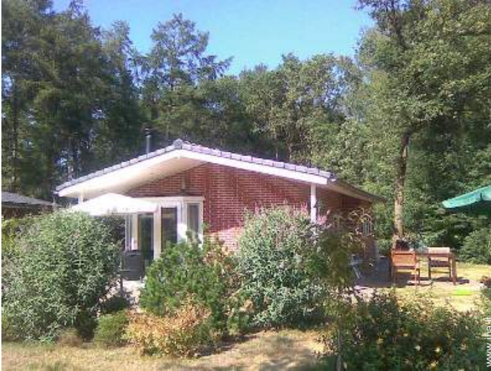
Capannina di Charme