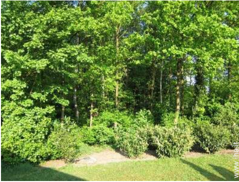
vista sulla foresta