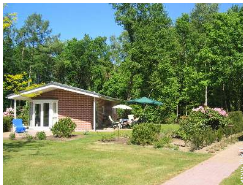
Capannina di Charme