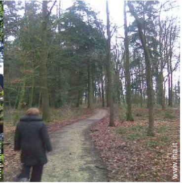
vista sulla foresta