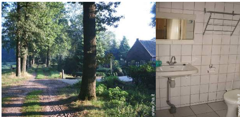
vista sulla foresta