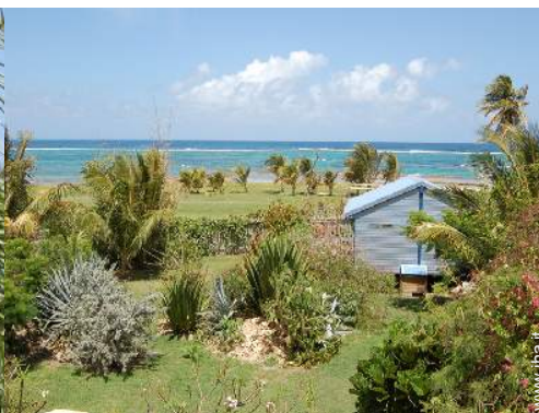
Bungalow di Charme