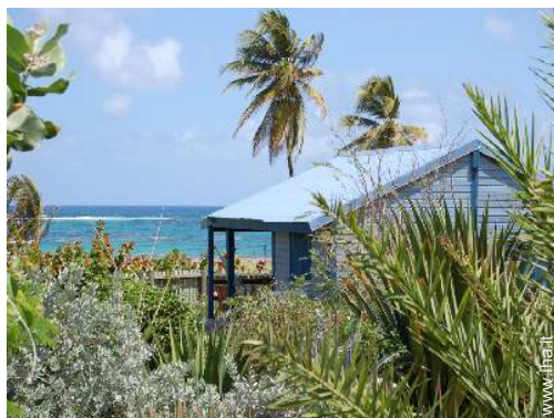
Bungalow di Charme