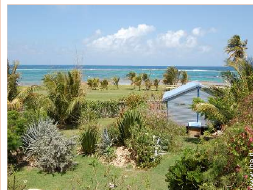
Bungalow di Charme