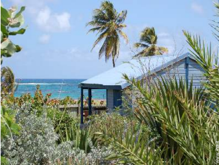
Bungalow di Charme