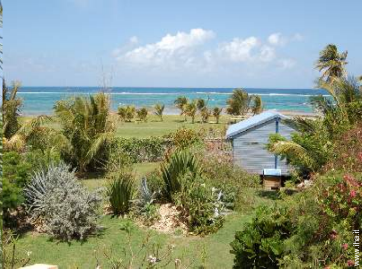
Bungalow di Charme