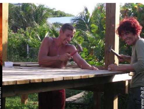
I vostri ospiti