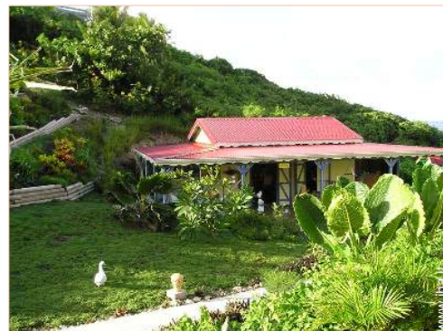
Casa in Legno di Charme