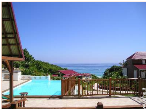
Piscina a sfioro