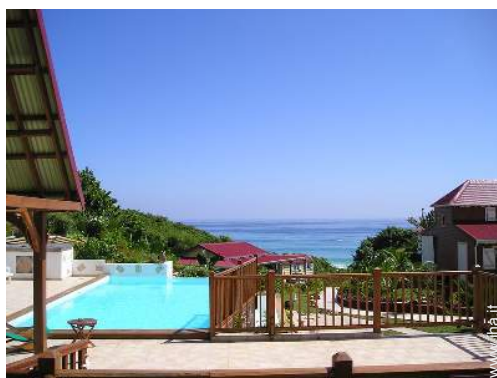
Piscina a sfioro