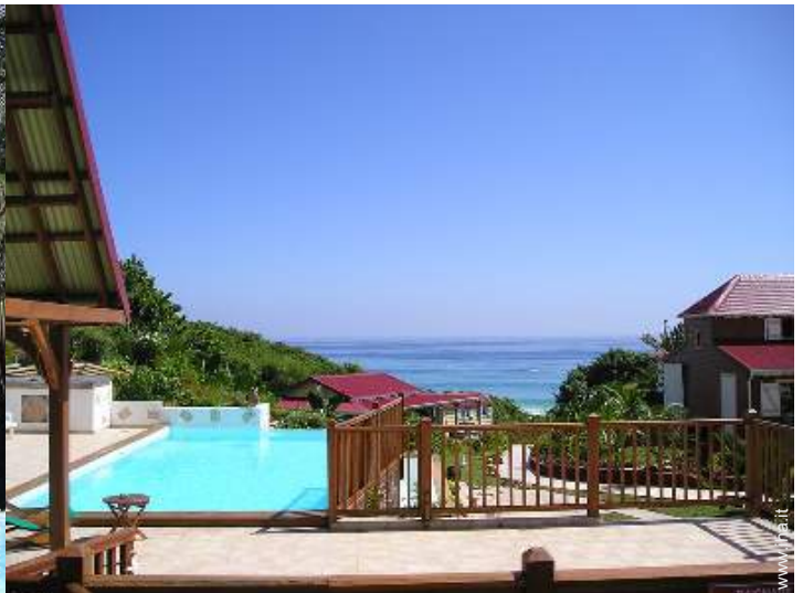
Piscina a sfioro