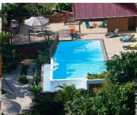
Piscina a sfioro