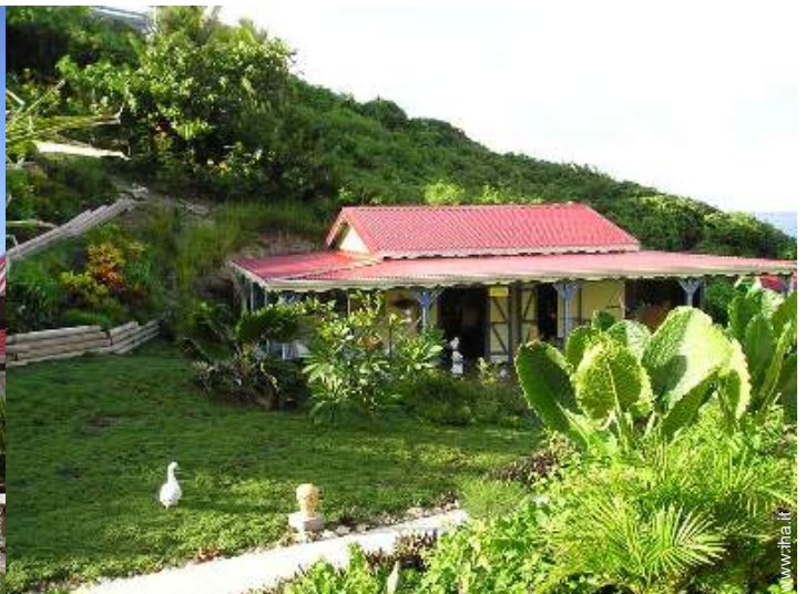
Casa in Legno di Charme