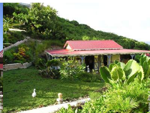
Casa in Legno di Charme