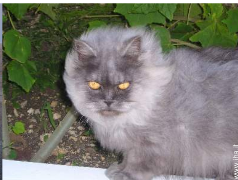
Gli animali domestici