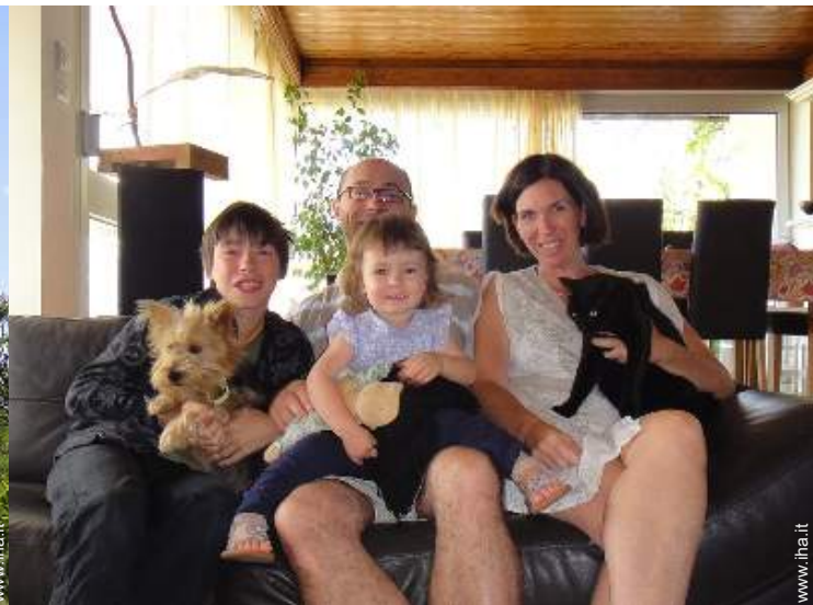
I vostri ospiti