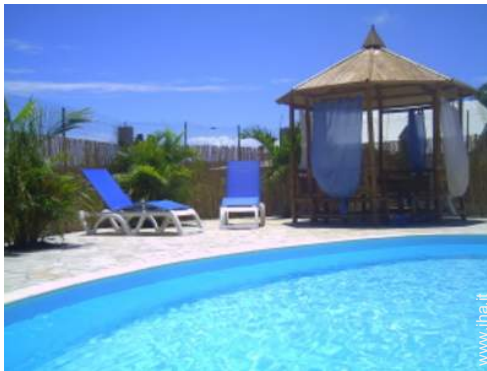
wifi (accesso ad internet senza filo)