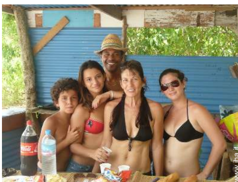
I vostri ospiti