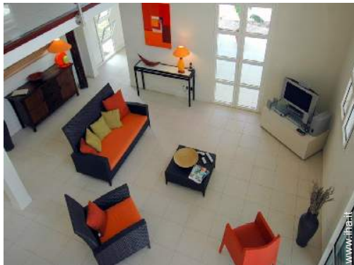
vista dal mezzanino