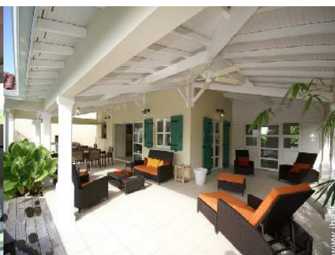
Villa di Prestigio