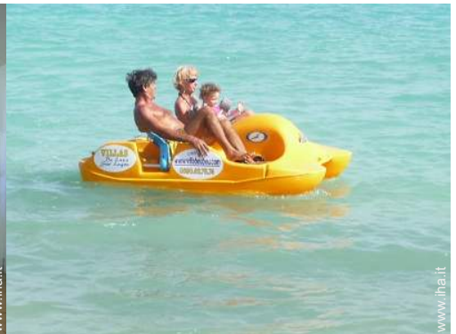
Villa di Prestigio