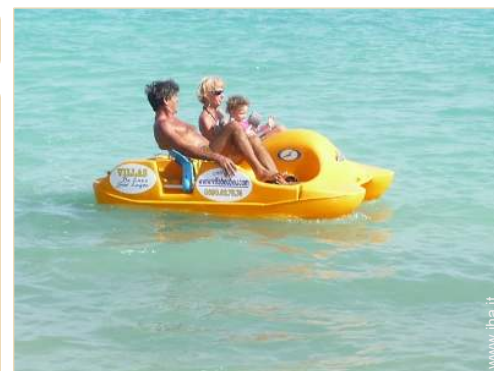
Villa di Prestigio

Salotto estivo, barbecue, barbecue a gas, tavolo da giardino, 10 sedia(e) da giardino, ombrellone, salotto da giardino, 10 chaise(s) longue(s), 10 sedia sdraio, 1 amaca(che), doccia esterna