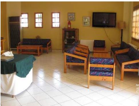
wifi (accesso ad internet senza filo)