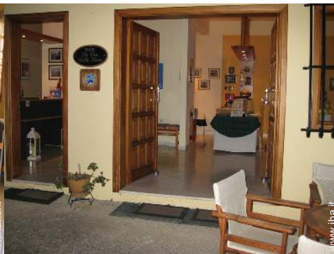
wifi (accesso ad internet senza filo)