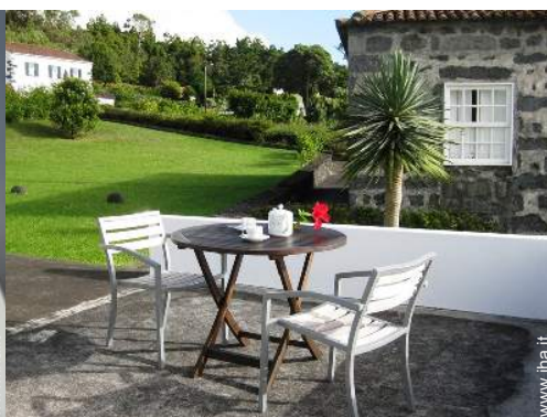
Attrezzature esterne a disposizione degli ospiti