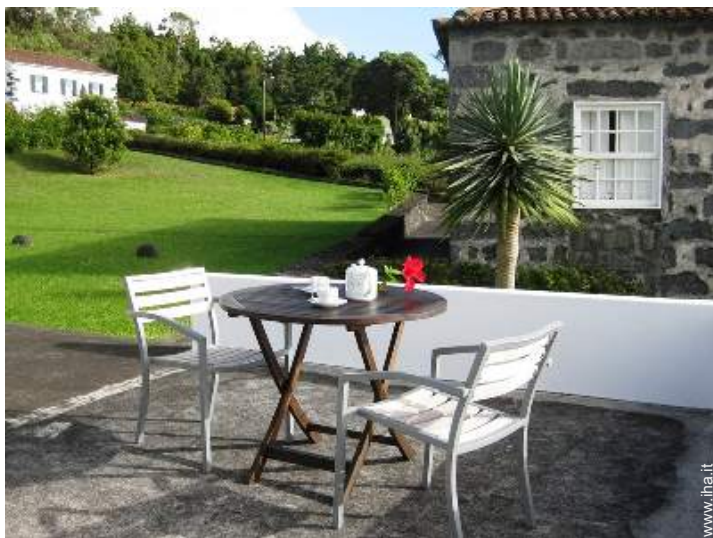
Attrezzature esterne a disposizione degli ospiti