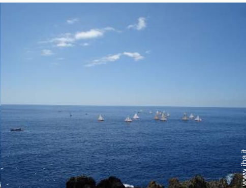
sport acquatici nelle vicinanze