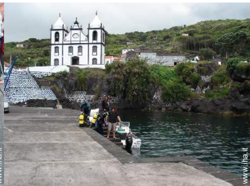
immersione con scafandro