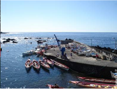
sport acquatici nelle vicinanze