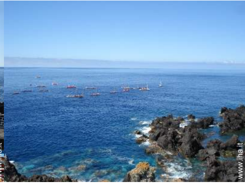
sport acquatici nelle vicinanze