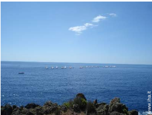
sport acquatici nelle vicinanze