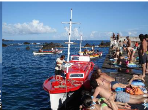
sport acquatici nelle vicinanze