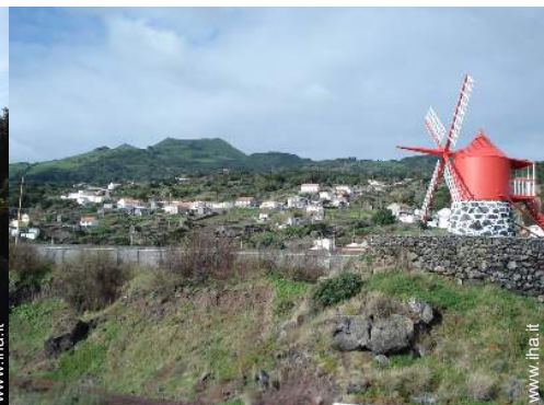
antichità &#38; anticaglie