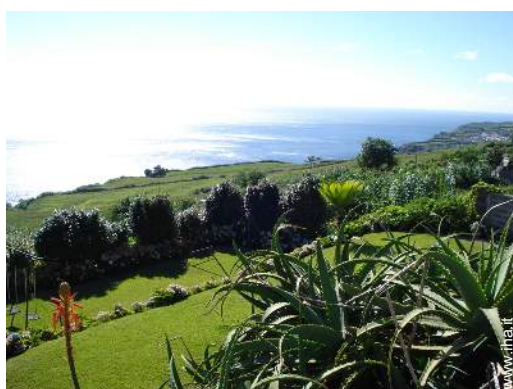
struttura rampicante per bambini