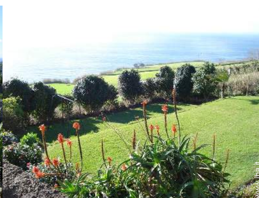
vista sui campi agricoli