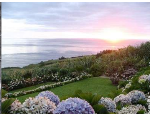
vista sul tramonto