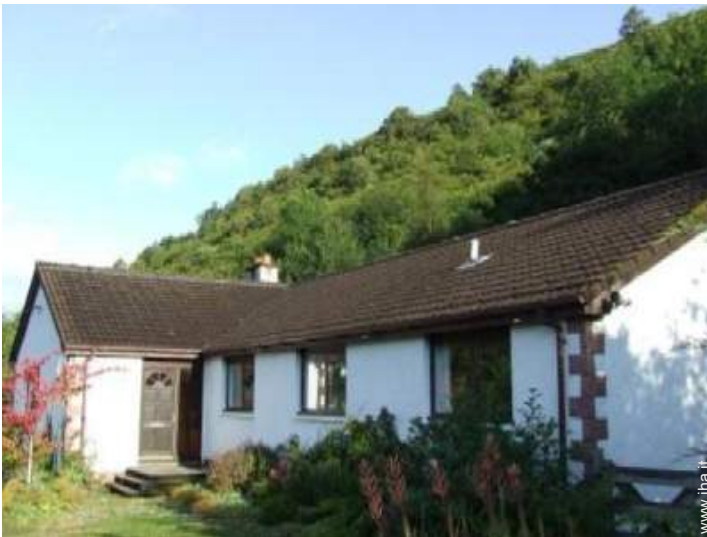
Bungalow di Prestigio