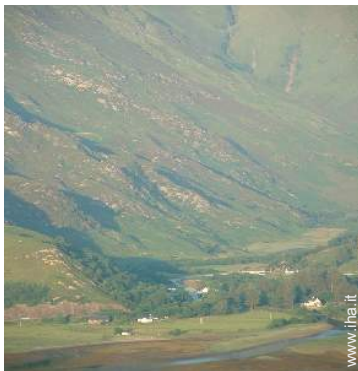
vista sul villaggio