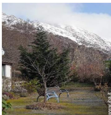
vista sulla montagna