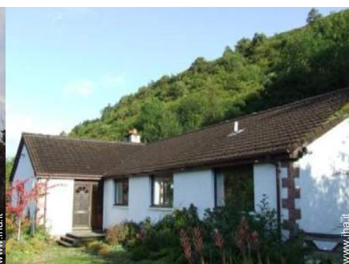
Bungalow di Prestigio