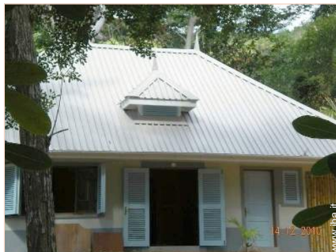
Casa Creola di Charme