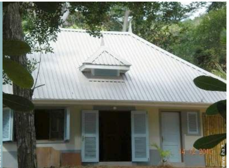
Casa Creola di Charme