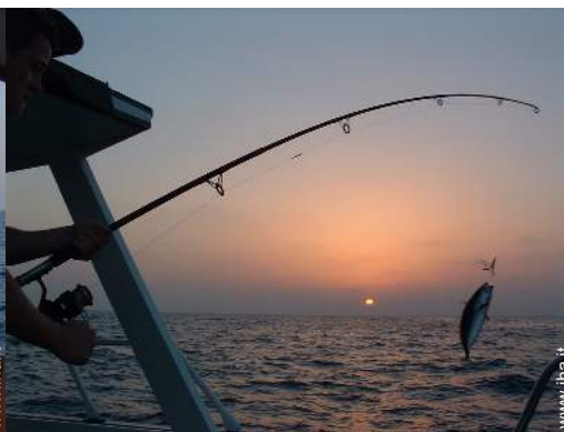
pesca con lenza