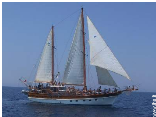
escursione in barca