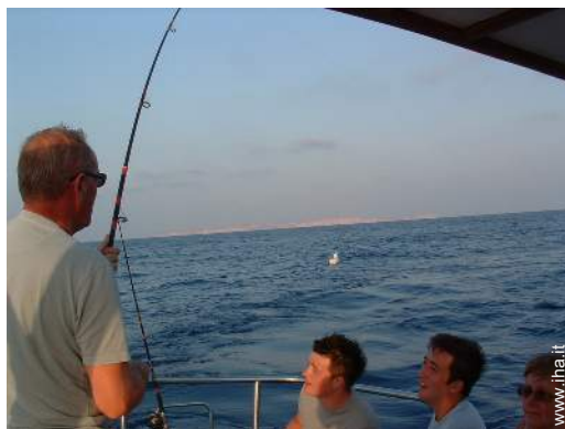
pesca con lenza