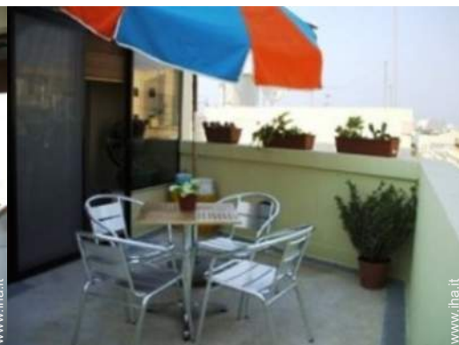
terrazzo sul tetto