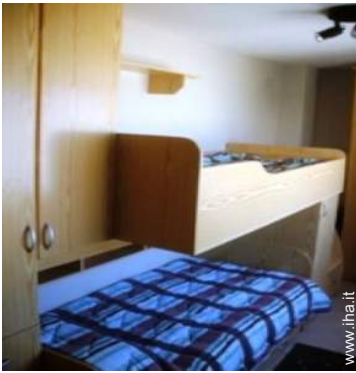
letti a castello