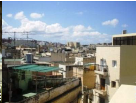
vista dalla terrazza sul tetto