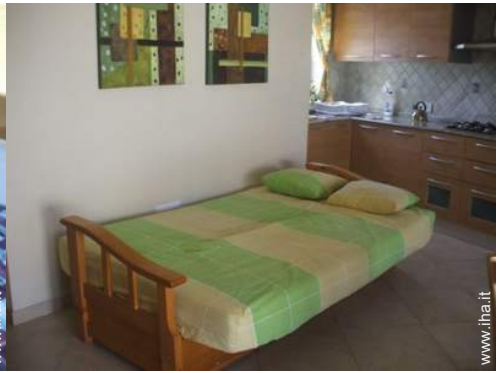
divano(i) letto 2 pers