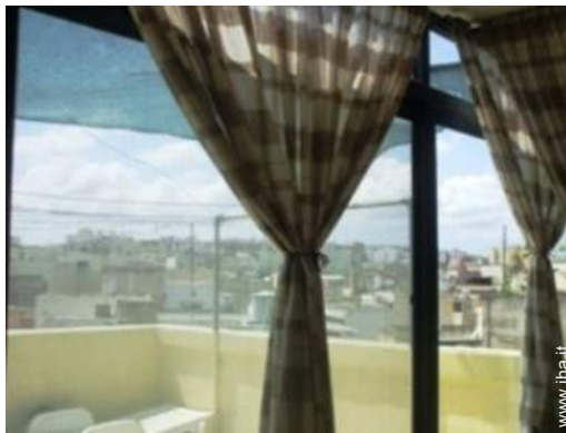
vista dalla terrazza sul tetto