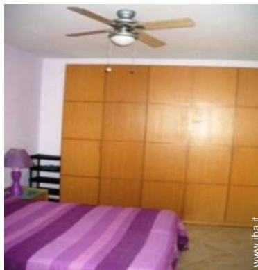
ventilatore a pale da soffitto