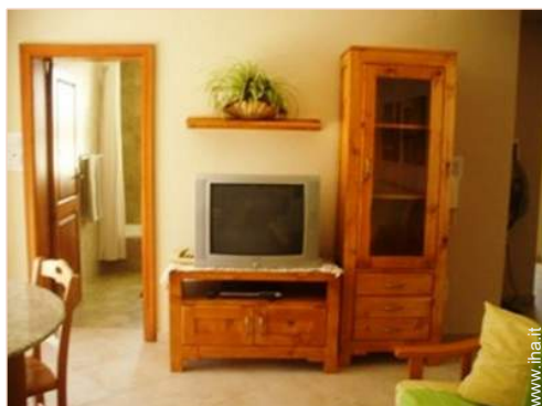
wifi (accesso ad internet senza filo)