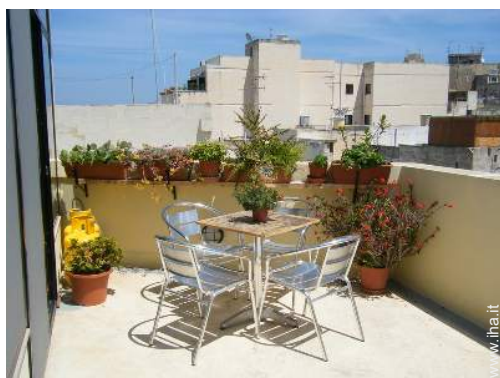
terrazzo sul tetto