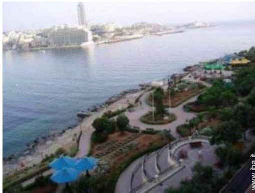
parco dei divertimenti