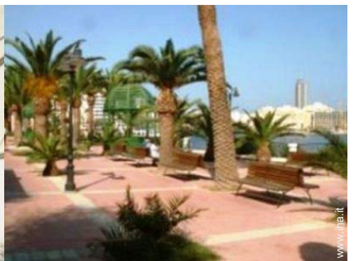
parco e giardino