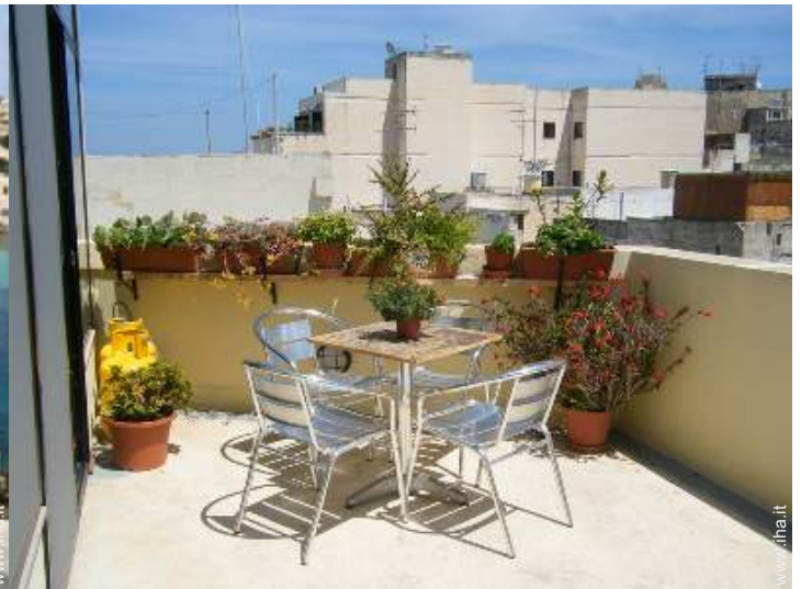
terrazzo sul tetto