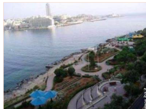
parco dei divertimenti