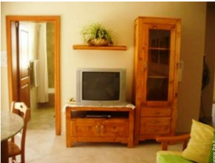
wifi (accesso ad internet senza filo)