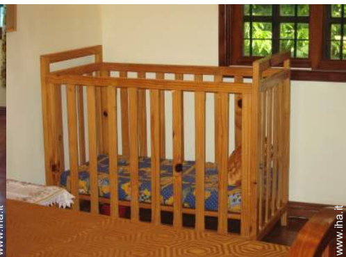
letto (i) bambino