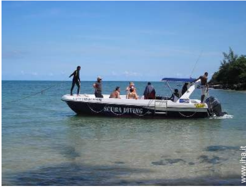
scuola di immersione