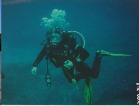
immersione con scafandro