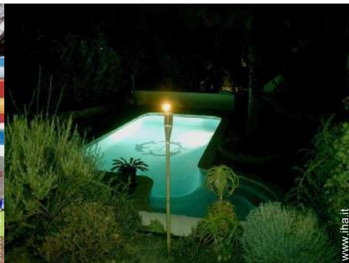
sistema di illuminazione