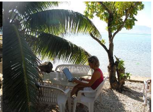
wifi (accesso ad internet senza filo)