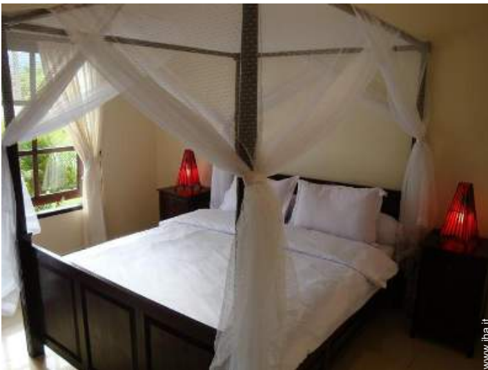
letto(i) matrimoniale(i) a baldacchino