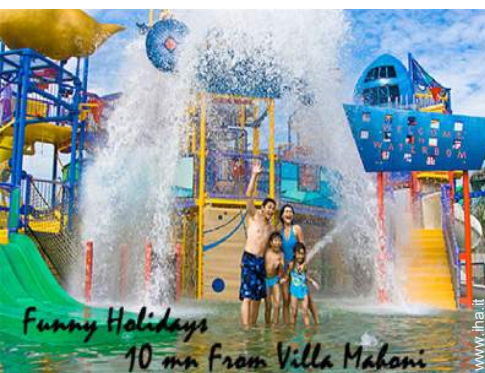
Funny Holidays 10 mn from Villa Mahoni