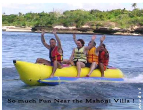
So much Fun Near the Mahoni Villa!