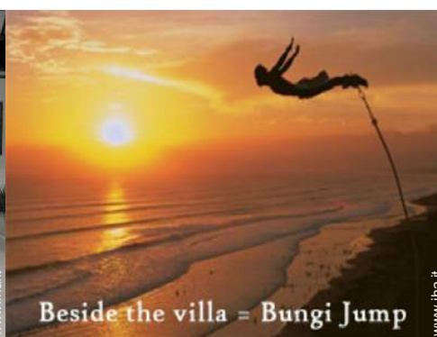
Beside the villa = Bungi Jump