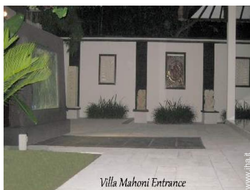
Villa Mahoni Entrance