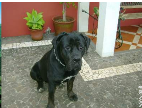
Gli animali domestici