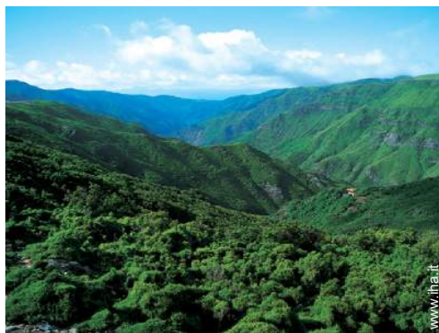
attività montane nelle vicinanze