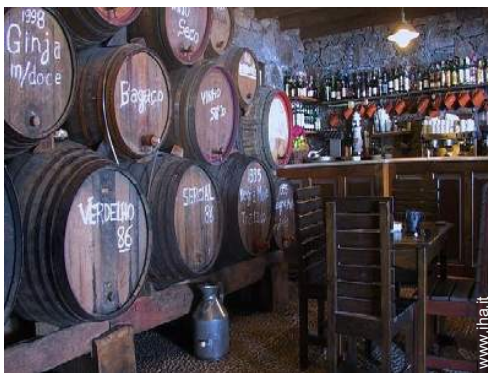
cantina e degustazione di vino