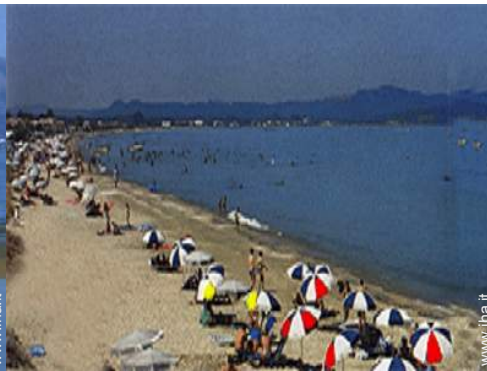
luogo per bagnarsi