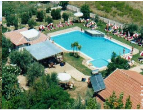
luogo per bagnarsi