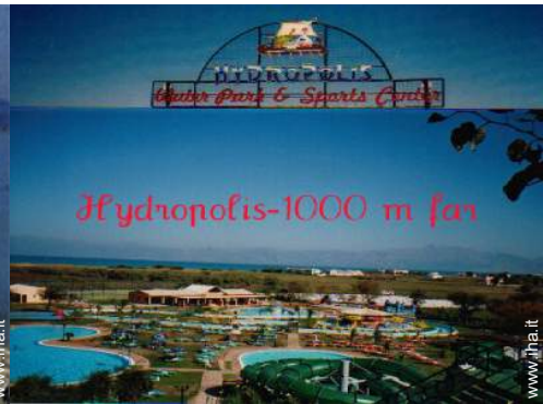
Attrazioni e relax