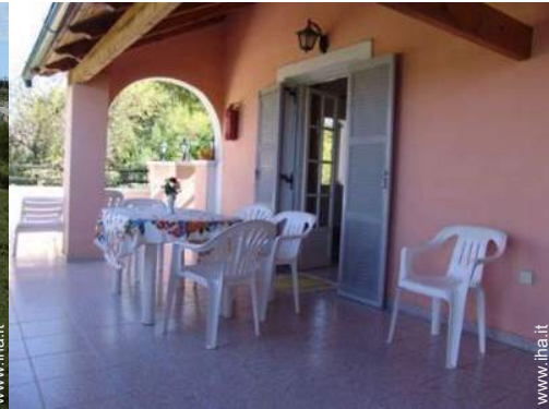
tavolo da giardino