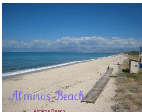
spiaggia con ciotoli