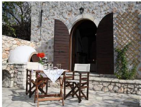
forno per pizze