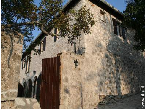
Casa in Pietra di Prestigio