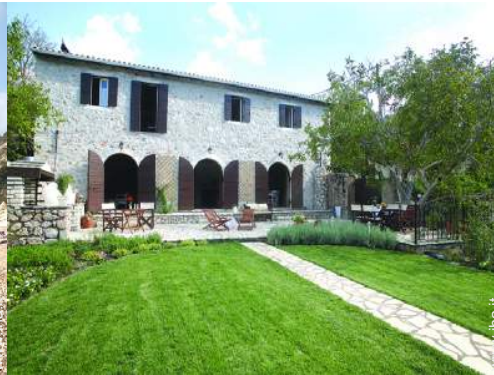
Palazzotto di Prestigio