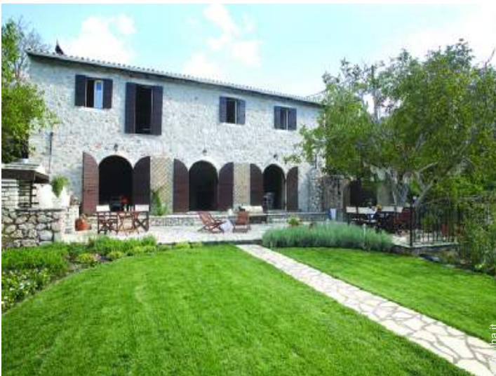
Palazzotto di Prestigio