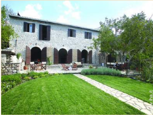
Palazzotto di Prestigio