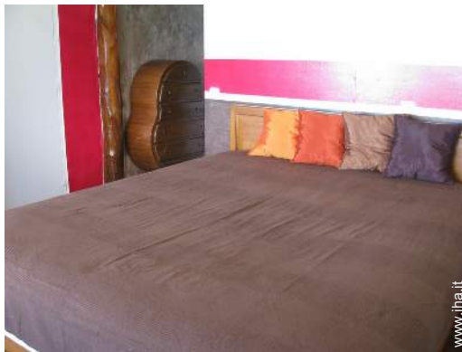
camera del proprietario