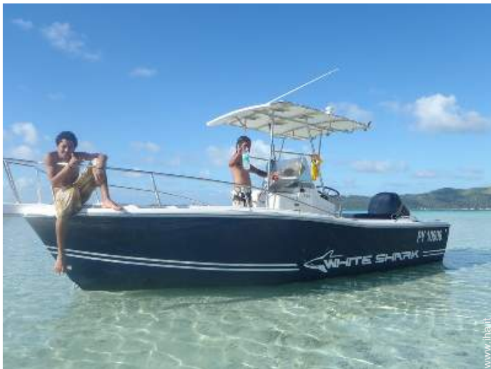
sport acquatici nelle vicinanze